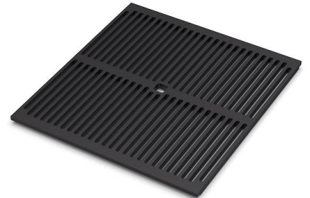
Black grid 8100 617