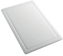
HDPE 砧板 8657 001